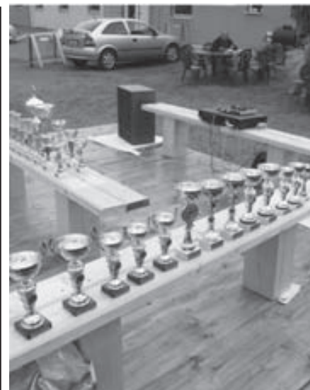
...nakoniec rozdáme ceny ľuďom, ktorí si ich zaslúžia!