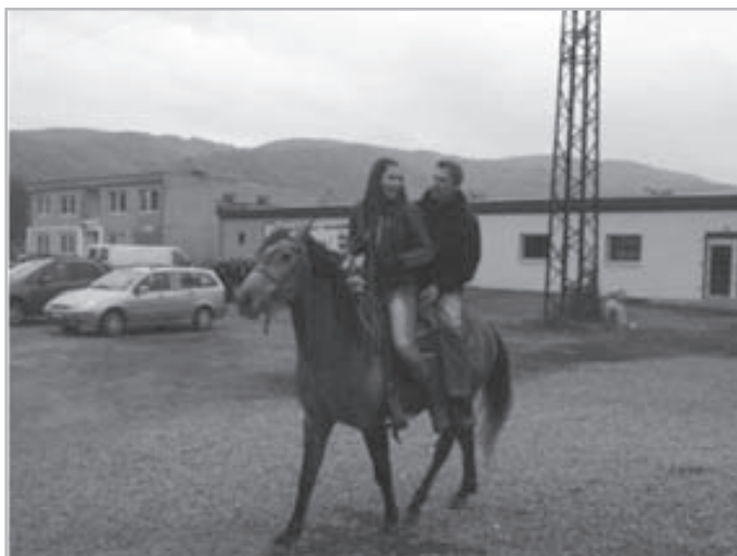
Na burzách a výstavách zvierat sa dá zažiť aj takáto romantika...

Chovatelia z našej organizácie patria k oblastnému výboru Žiar nad Hronom. OV Žiar nad Hronom pôsobí a vyvíja chovateľské aktivity v troch okresoch (ZH-ZC-BS) a pre jednoduchšiu komunikáciu sme zmenili názov OV SZCH Žiar nad Hronom na OV