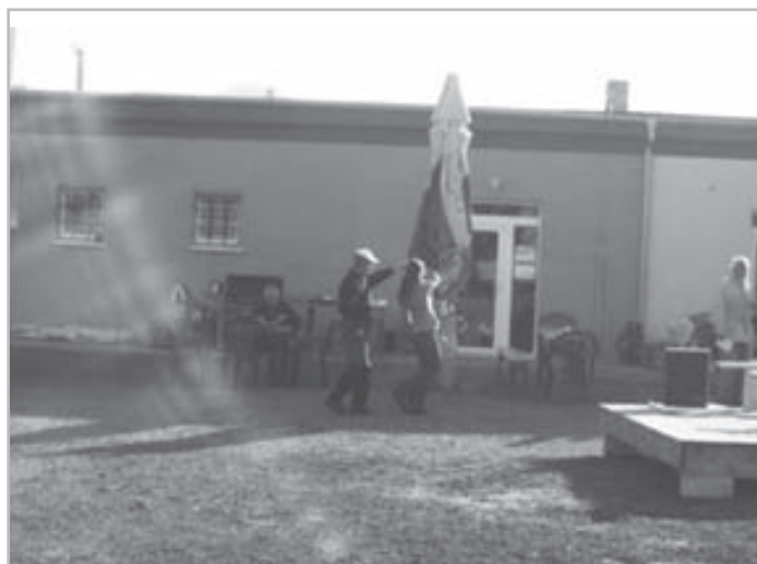
...ale aj dobrá hudba a spontánny tanec...