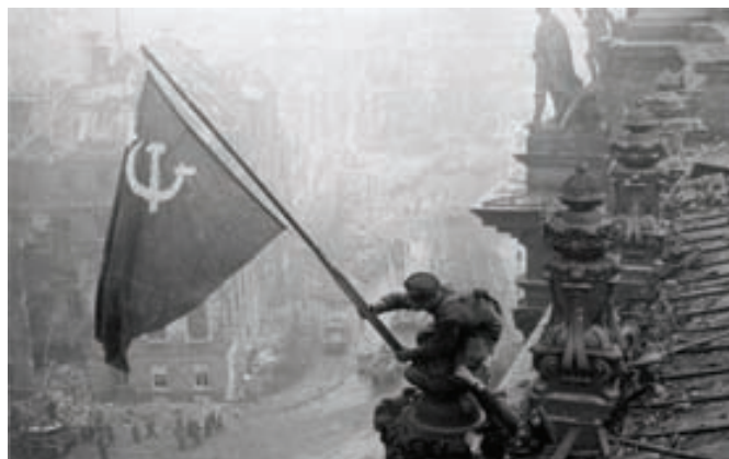
koniec 2. Svetovej vojny - Sovietsky vojak vztyčuje vlajku nad budovou Berlínskeho ríšskeho snemu

Ruskí partizáni si 20.2. 1945 zobrali 2 kone „u Fučkov“ od gazdu Ladislava Beňa. Po prechode frontu 3.4.1945. v obci si táboriaca Rumunská armáda pri odchode so sebou vzala 1 ročnú žrebicu od Jozefa Beňa č.d. 40.